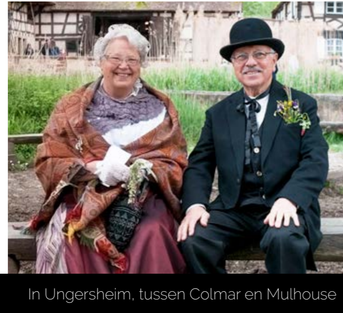
In Ungersheim, tussen Colmar en Mulhouse