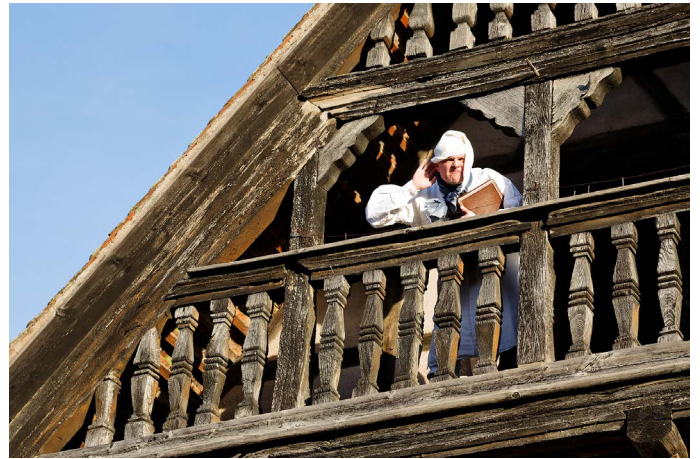
Le bourgeois de Schwindratzheim a été réveillé par le bruit.