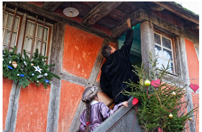
...la maison sera protégée par l'inscription 20 + C-M-B + 23.