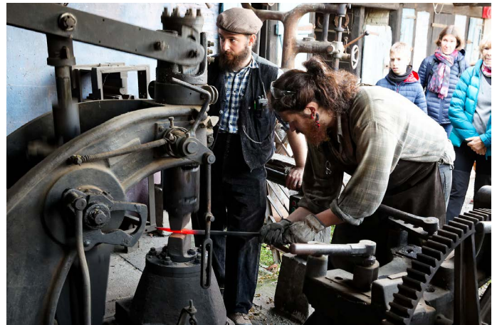
Atelier marteau-pilon à la forge.