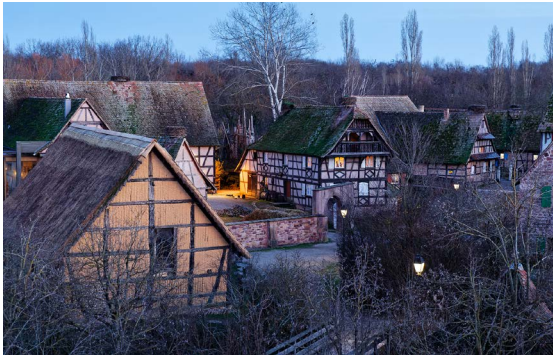
Le village s'endort pour l'hiver.