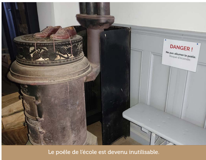
Le poêle de l'école est devenu inutilisable.

prendre le risque de mettre des gens en danger ou le feu à la maison. Aucun suivi sérieux ne semblait avoir été mis en place avant. Malgré les mises en garde, le poêle de l'école a été trop chargé et il a surchauffé lui aussi il y a un mois à peine. Ce sont des équipements déjà anciens qui demandent un certain savoir-faire dans la conduite du feu. À mon grand regret, j'ai dû faire prendre la décision d'interdire leur utilisation.