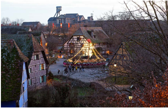
La couronne de l'avent vit ses derniers feux.