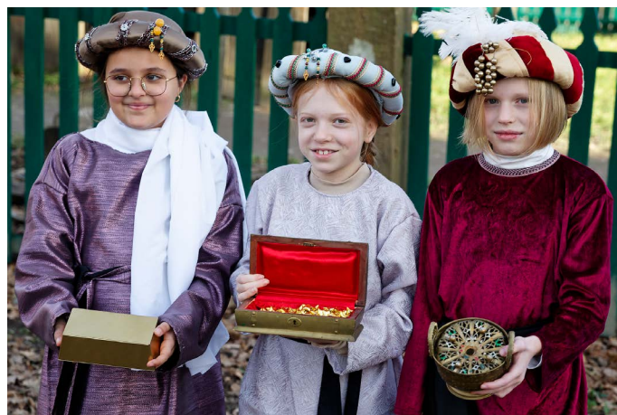
Les offrandes des petits rois petites reines.