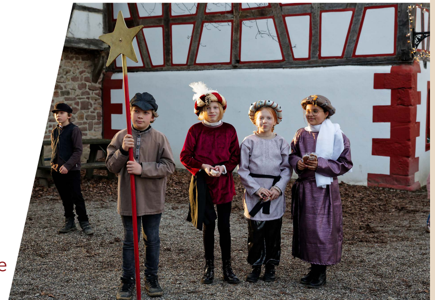
Les petites reines et leur aréopage vous souhaitent une bonne année 2023 !