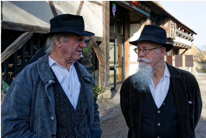
Atelier chuchotements devant la MGC. Mais que se disent-ils donc ?