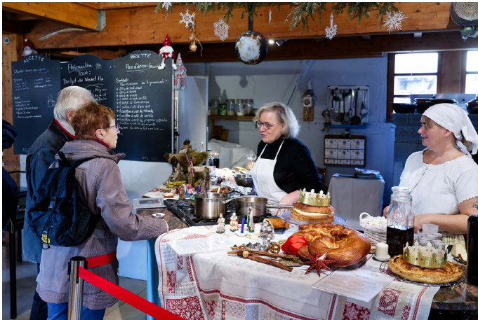
Atelier cuisine à la MGC.