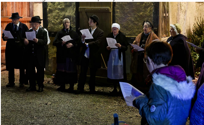
Atelier chorale sur la place des artisans.