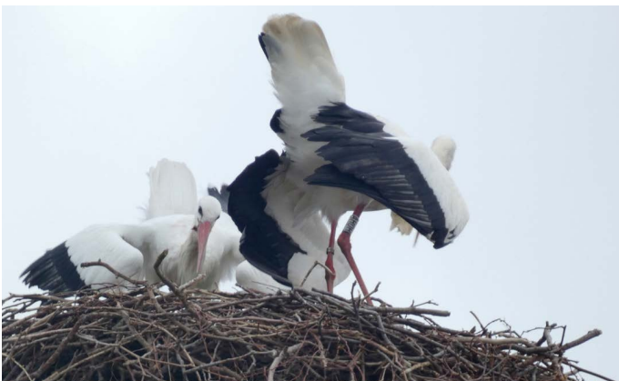
Les deux partenaires ont offert le spectacle d'une parade spectaculaire - sans accouplement - alors que passait au-dessus du site un troisième individu qui ne s'est heureusement pas posé sur le nid.