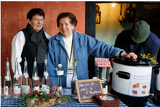
Atelier dégustation de schnaps et jus de pomme à Merxheim.