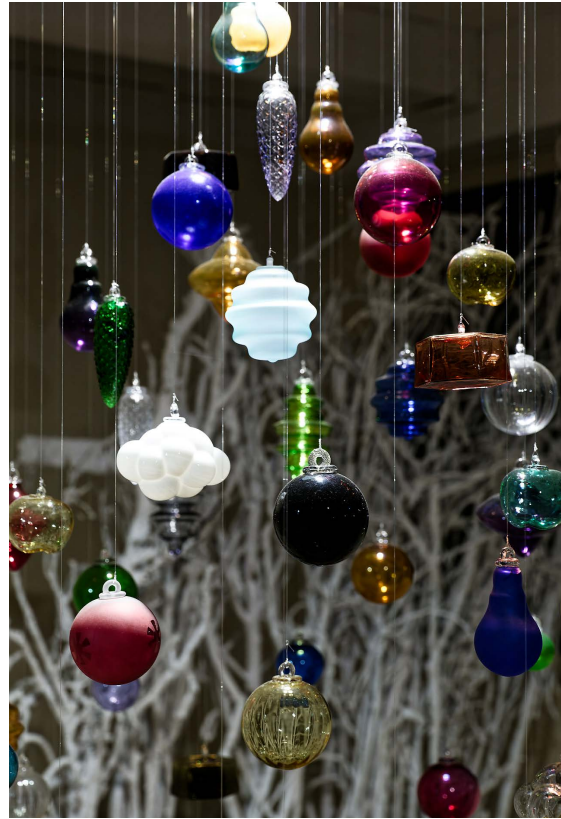
Les boules de Noël de Meisenthal à l'accueil billetterie.

Vous cherchez à en savoir plus sur les maisons, les traditions de Noël, les arbres remarquables, les animaux commensaux ?