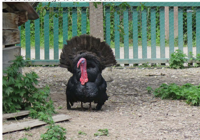
Les dindons ont parfois l'envie de voir le monde.