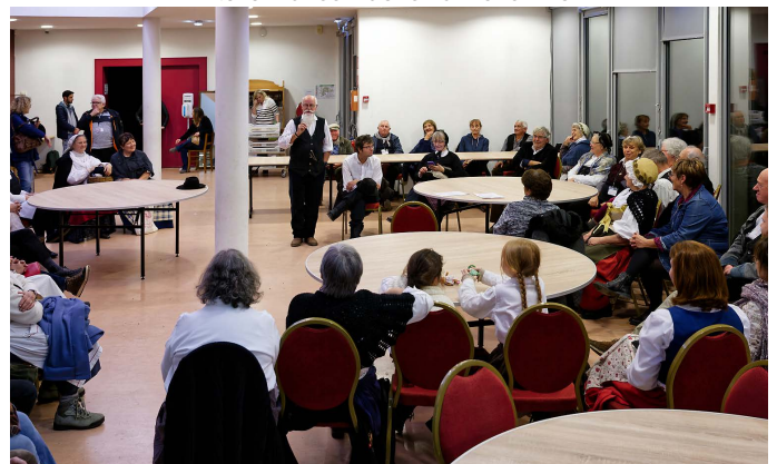
Atelier galette des rois pour finir la saison en salle des cigognes.