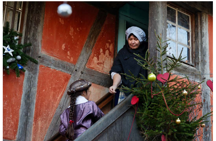
Lorsque les habitants sont généreux...