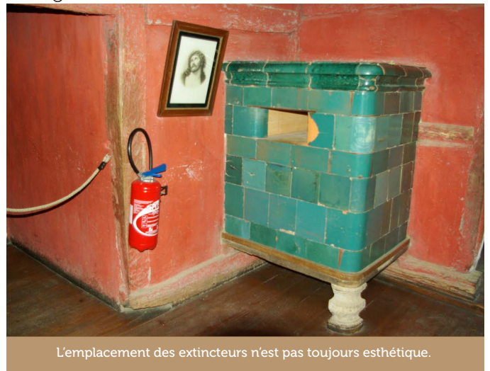
L'emplacement des extincteurs n'est pas toujours esthétique.

Quand, au retour de la visite d'un Écomusée, on regarde ses photos et qu'on ne voit que l'extincteur rouge vif, bien en évidence, la prise de vue est gâchée. N'y a-t-il pas moyen de le dissimuler ?