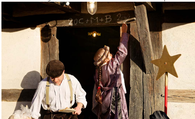
Bénédiction de la maison de Gommersdorf.