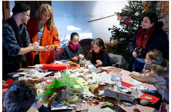
Atelier bricolage à la MGC.