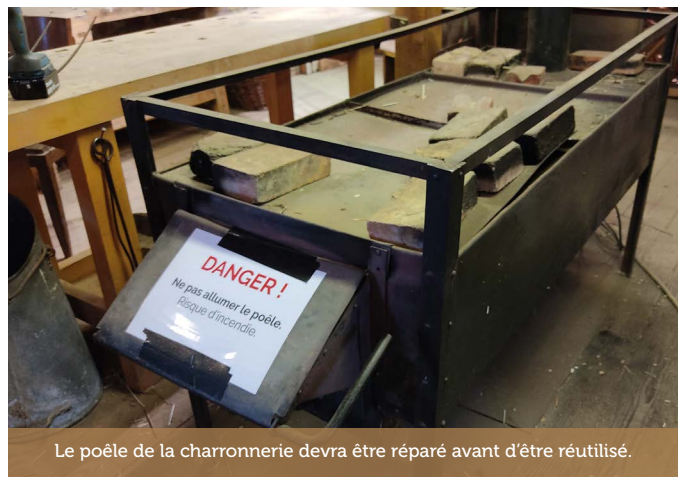
Le poêle de la charronnerie devra être réparé avant d'être réutilisé.

Exactement. Lors du passage annuel obligatoire du ramoneur, celui-ci a constaté que malheureusement, certains poêles ont été mal utilisés, certains ont surchauffé au point que les briques réfractaires ont été endommagées et devront être remplacées. Dans d'autres maisons, les conduits de cheminée sont fissurés ou des nids ont été construits au-dessus par des cigognes. Je sais que ces mesures arrivaient au mauvais moment, alors que la saison de Noël battait son plein et qu'on avait besoin de chauffer les pièces pour permettre les animations, mais on ne peut pas