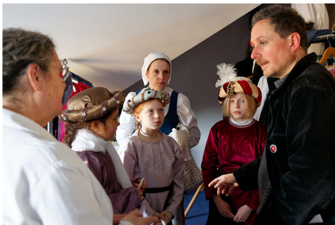
Dernières instructions avant de se lancer.

Merci à tous ceux qui ont participé de près ou de loin à l'organisation de la saison de Noël 2022, malgré tous les écueils, les événements qui ont marqué le début du mois de décembre, les restrictions dues à la crise énergétique. Nous sommes décidés à rendre à Noël 2023, si rien ne se met en travers du chemin, le faste et les lumières des grands Noëls précédents. L'Écomusée compte sur nous.