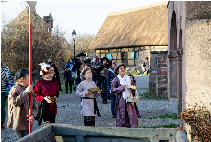
Holà, du balcon !