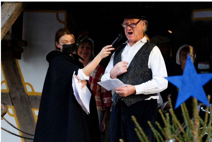
Guy déclame le texte traditionnel.