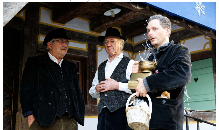
La fête est finie, le musée va fermer dans quelques heures.