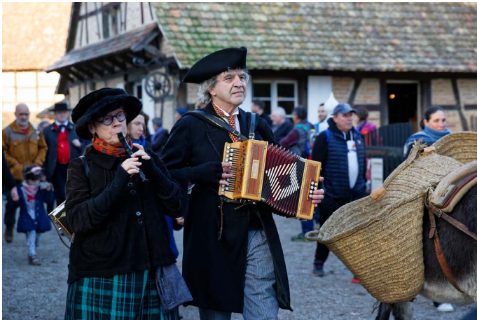
Les Comparses ont animé le cortège.