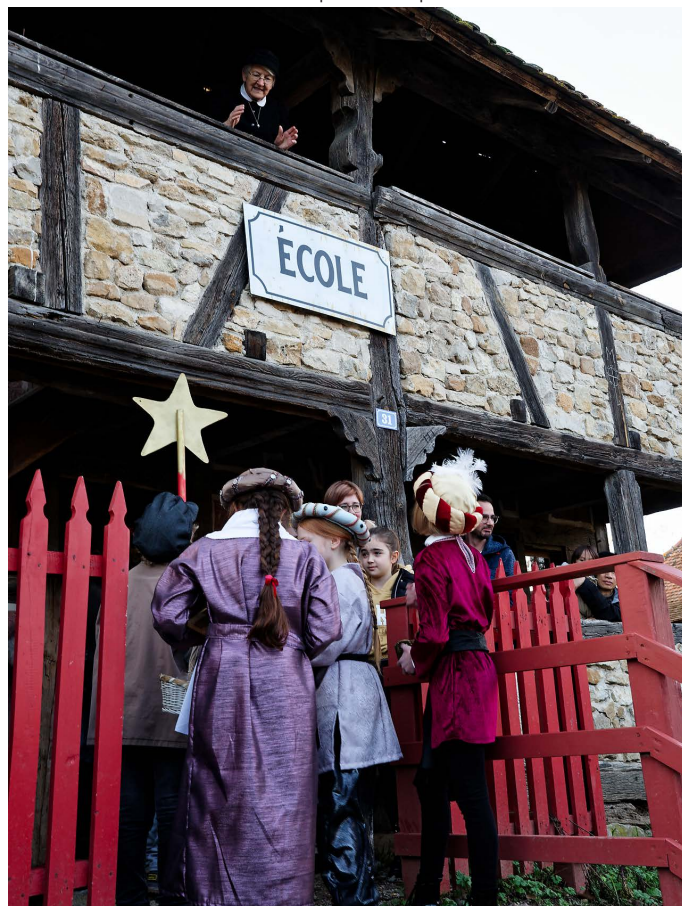
La maîtresse d'école a également droit à une visite.