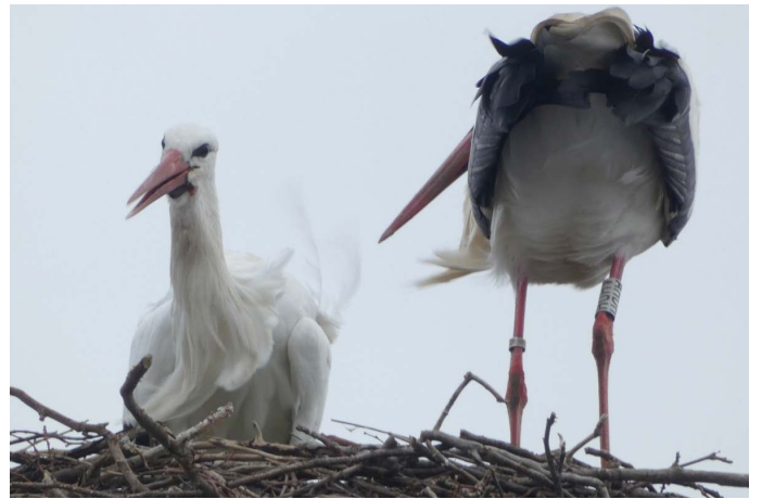
Par conséquent, le couple en place n'a pas été perturbé, il n'y a pas eu d'affrontement, il a pu poursuivre sa parade.