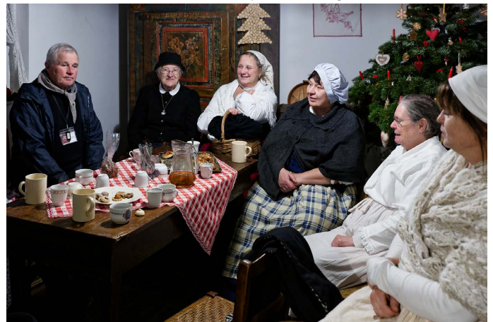
Atelier Kaffee-Kuchen à Monswiller.