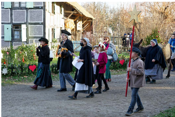
Le cortège se rend de maison en maison en musique.