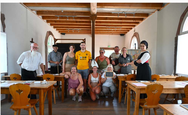
Session de 13 h 30, dimanche 9 juillet.