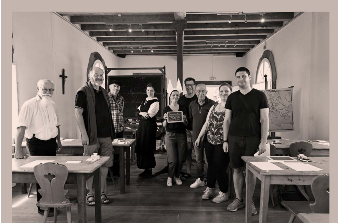
Première session du samedi 8 juillet.