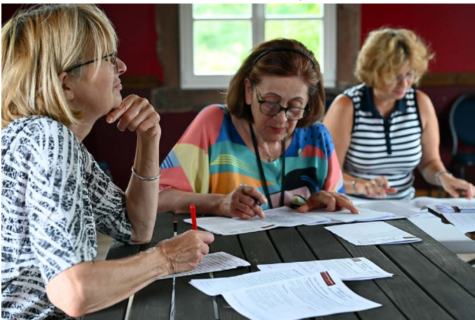
Les correctrices sont intransigeantes.