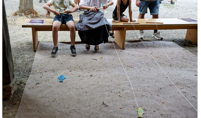
Course de poissons.