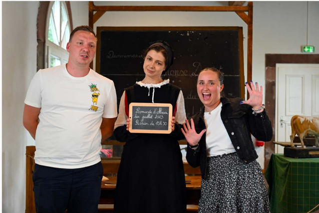
Certificat d'études - Ecomusée d'Alsace - 2023/07/01 - 13h30

Le certificat de fin d'études primaire a fait peau neuve cette année : non seulement le lieu a été transféré de l'étage de l'école de Blotzheim à la grande salle de la gare, mais la période de passation de l'épreuve a, elle aussi, été avancée au mois de juillet, ce qui correspond davantage à la réalité historique. En effet, les examens ont traditionnellement lieu en fin d'année scolaire et non pas au début. À vos plumes !