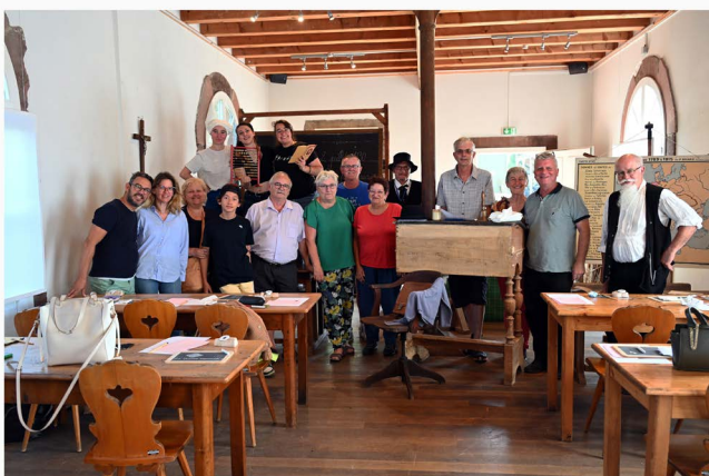
Certificat d'études - Ecomusée d'Alsace - 2023/07/02 - 15h30