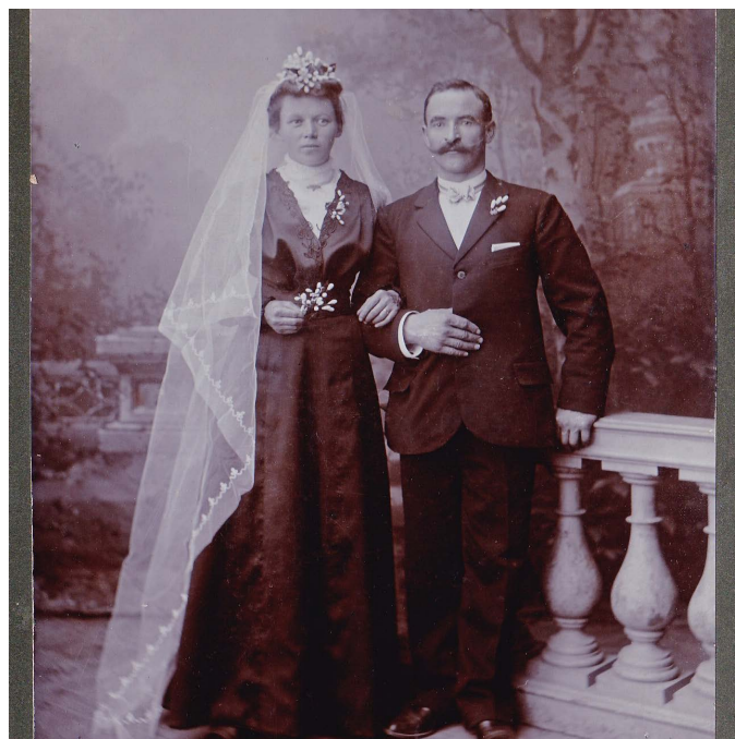
La mariée était en noir.

Ces photographies anciennes, grâce à leur existence et à la variété de leurs sujets, constituent une richesse, non par leur valeur marchande, mais parce qu'elles sont sources de savoirs : paysanne âgée au regard qui en dit long sur un vécu sans doute difficile, dame de la bourgeoisie et son ombrelle assise à l'arrière d'une automobile décapotable, militaire posant fièrement en uniforme de parade, groupes de musiciens avec leurs instruments et canotier sur la tête, enfants en tablier d'école posant avec leur instituteur, etc. Elles sont une aide précieuse pour la mémoire de ces époques anciennes, car elles nous renseignent ou confortent nos connaissances non seulement sur les diverses tenues vestimentaires portées alors, la disposition et le mobilier de l'intérieur des foyers, les modes de vie, les pratiques artisanales, mais aussi sur l'évolution des paysages, des habitations et édifices aujourd'hui modifiés ou disparus.