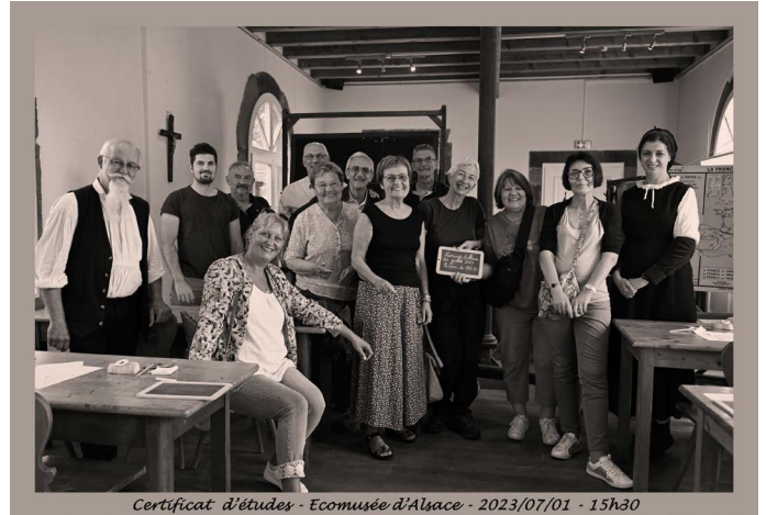
Certificat d'études - Ecomusée d'Alsace - 2023/07/01 - 15h30

Les premiers candidats du samedi 1 er juillet.