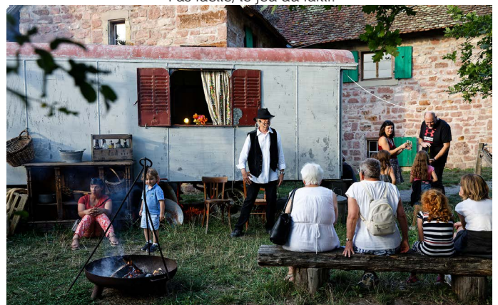
Histoires de conteurs un peu gitans.