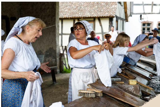
Les lavandières se passent un savon.