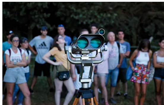
Visite guidée « La nuit des étoiles » le 12 août.