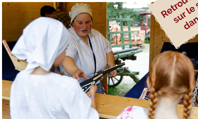
Tir au fusil à l'élastique.