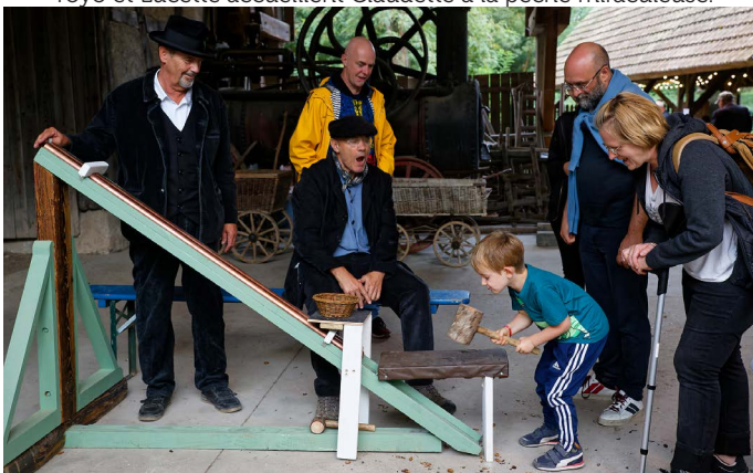
Le « casse-glands », nouveau jeu 2023.