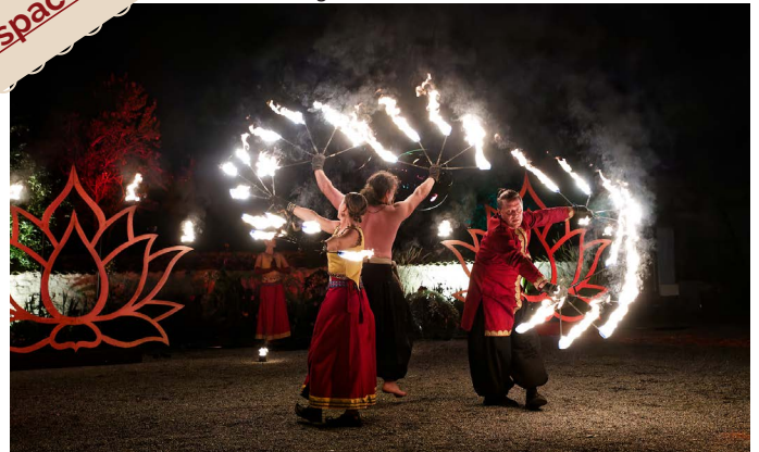
Le spectacle de feu.

Retrouvez toutes les photos sur le site de l'Ecomusée dans l'espace protégé.