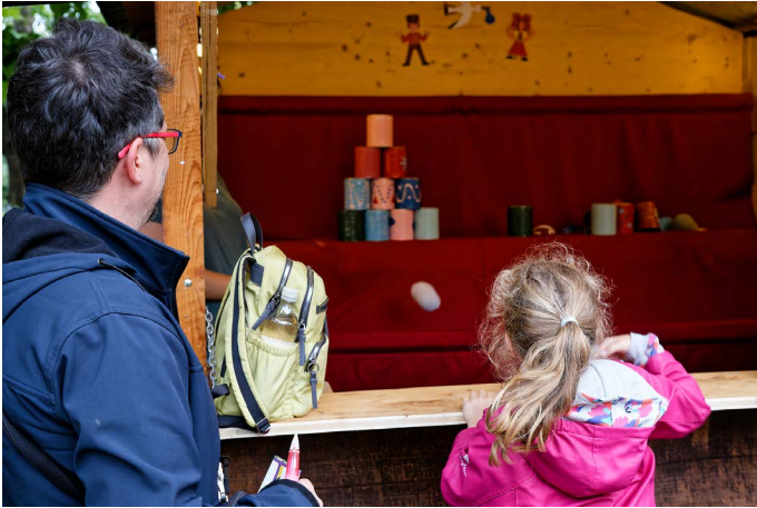
Le « chamboule-tout ».