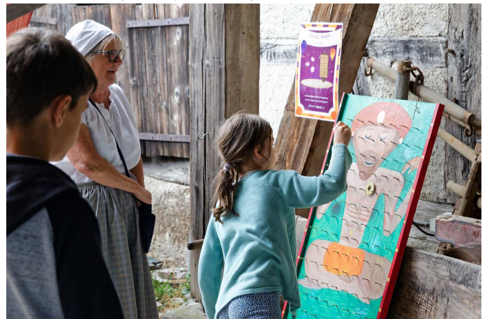
Pas facile, le jeu du fakir.