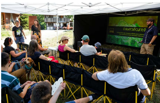
Animation nature au pavillon de Guebwiller.