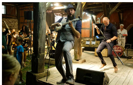
« La Camelote » en concert du 11 au 13 août.