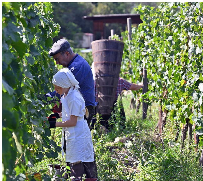
Les vendanges se font à l'ancienne.