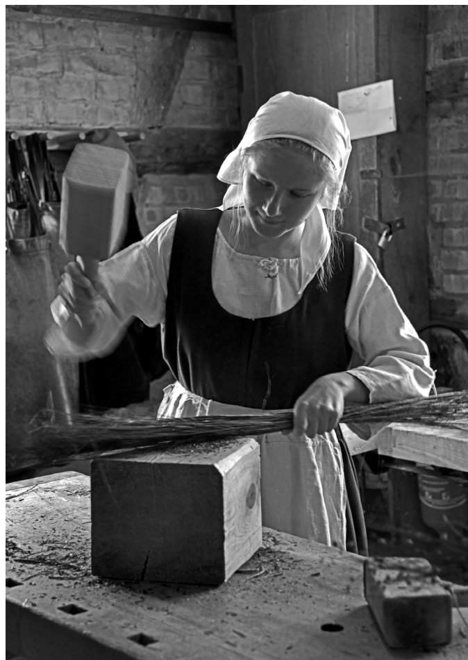
Battage des fibres au maillet.

Le lieu justement est en soit largement moins étendu que notre écomusée (il s'agit grosso modo d'un corps de ferme entièrement muséographié, augmenté d'une cour arrière réservée, elle, à la médiation et aux animations ponctuelles), il est quasiment aussi complet : tout y est scénographié dans le moindre détail, parfois jusqu'aux tiroirs et placards entrouverts. Il a ceci de magique de n'être physiquement séparé du village que par les barrières de lattes qui ferment ses deux cours. Outre les passages obligatoires (la petite et la grande Stuwa , son alcôve, la cuisine, son Keschtle et sa Räuchkammer , les chambres), on y trouve encore une chambre de cocher, une laiterie, une salle de classe.