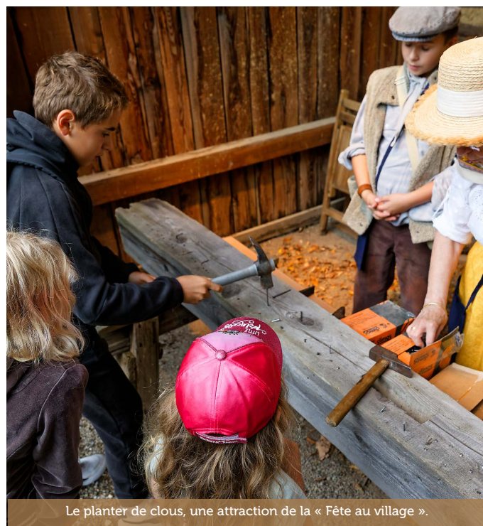
Le planter de clous, une attraction de la « Fête au village ».

Si certains, comme la succession de températures inédites par leur niveau et leur durée, sont préoccupants, d'autres (16 404 visiteurs en 7 soirées festives, soit une moyenne de 2 343 visiteurs par jour !) constituent de réjouissantes récompenses aux efforts accomplis par tous. Merci à l'ensemble des salariés, bénévoles et bénévoles d'un jour pour le remarquable travail accompli !