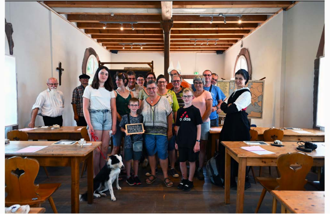
Session de 13 h 30, le 8 juillet.