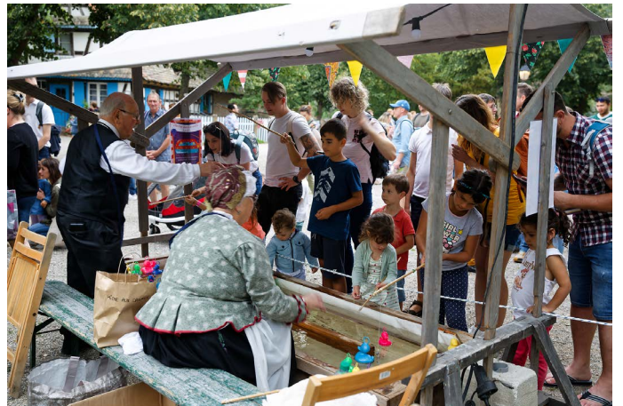
La pêche aux canards, une affaire de concentration.