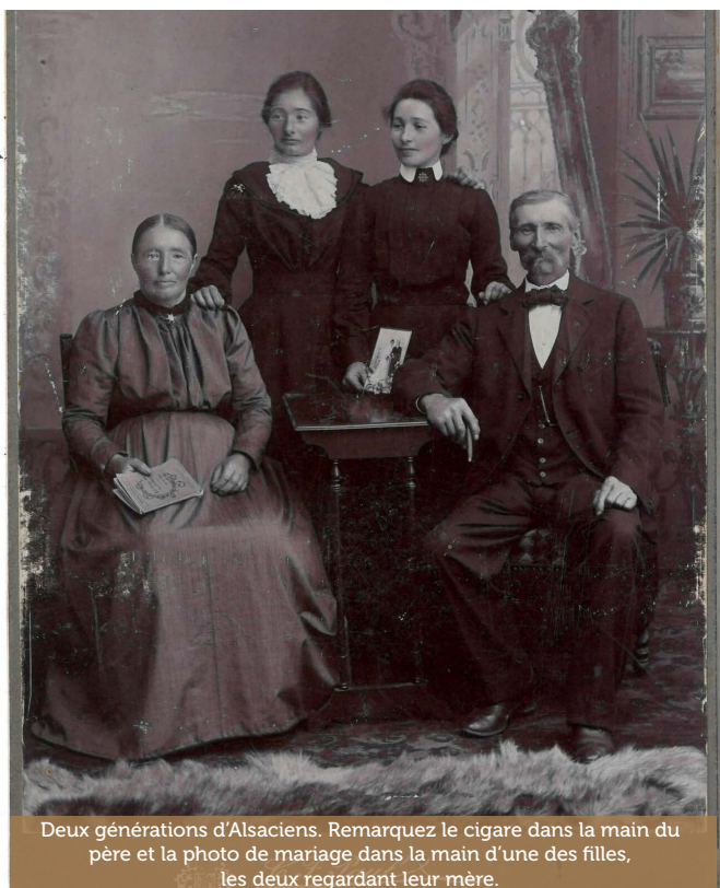
Deux générations d'Alsaciens. Remarquez le cigare dans la main du père et la photo de mariage dans la main d'une des filles, les deux regardant leur mère.

Tous ces souvenirs de nos aïeux sont parfois émouvants, plaisants, voire cocasses mais toujours instructifs. Nous vous donnons rendez-vous dans les prochains numéros pour découvrir d'autres photographies anciennes de la collection de l'Écomusée parmi les plus charmantes, captivantes, rares et étonnantes.