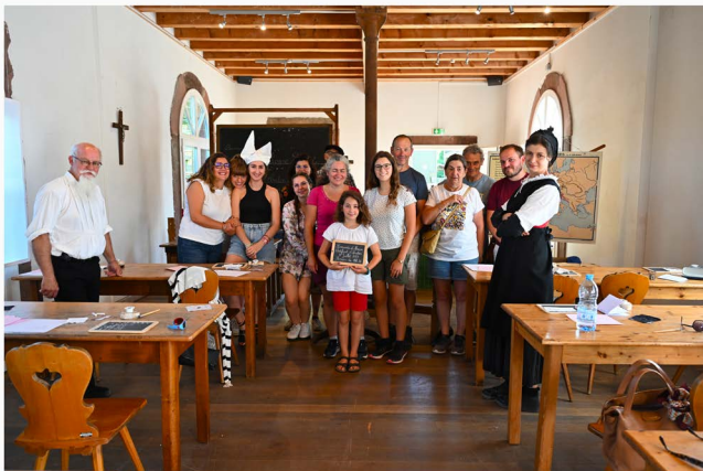
Session de 15 h 30, le 8 juillet.