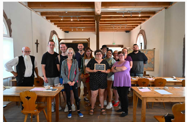
Certificat d'études - Ecomusée d'Alsace - 2023/07/02 - 13h30

Les premiers candidats du dimanche 2 juillet.