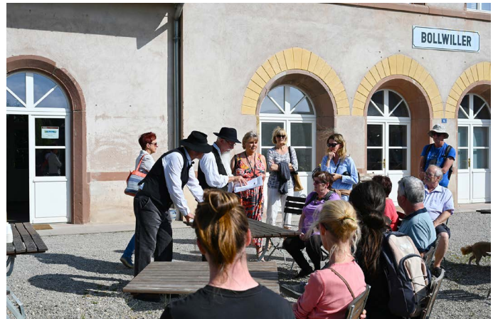
Proclamation des résultats, séquence émotion.