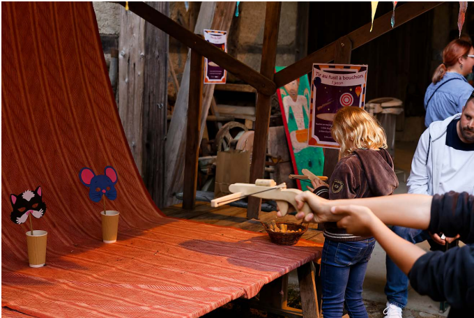
Tir de bouchons à l'arbalète.