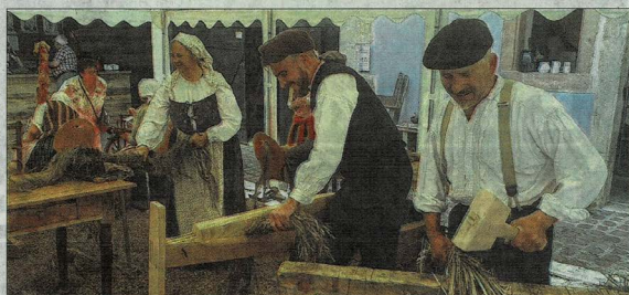
De droite à gauche, des démonstrations de maillage, de broyage et d'espadage du chanvre.

Très pratiquée en Alsace jusqu'au XIX e siècle, la culture du chanvre avait une utilisation variée, allant de la fabrication textile à la production de cordages et du papier. Confondu avec son cousin le cannabis ou la marijuana, le chanvre a longtemps souffert d'une mauvaise