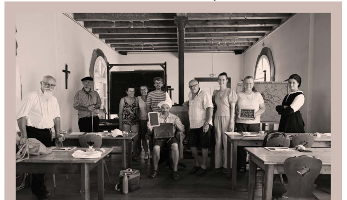
Dernière session du 9 juillet.