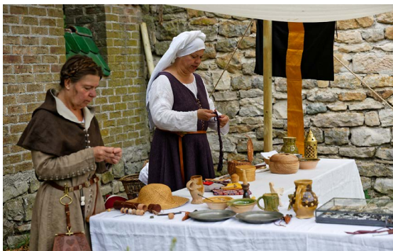
Le Moyen Âge s'est invité à l'Écomusée le 16 juillet.