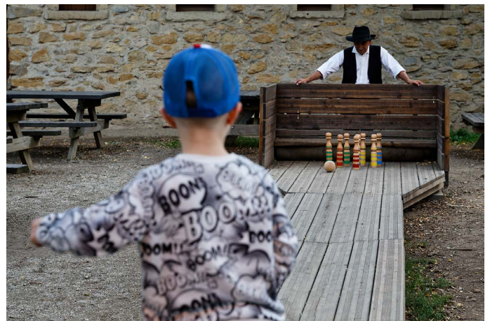
Le jeu de quilles a toujours un succès fou.