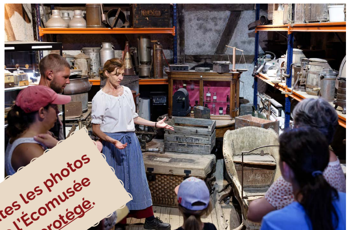
Visite du grenier aux souvenirs.

Nous avons passé une belle journée, du matin à 23h car il y avait la fête du village. L'écomusée vaut vraiment le déplacement. Vous revivrez la vie d'un village alsacien entièrement reconstruit avec les maisons d'origine, avec les habitants en costume ramenés à la vie par des gens très gentils et serviables. La balade en barque le long du canal et la balade à travers la campagne en chariot tracté par deux filles gentilles et compétentes ont été une très agréable surprise. Ainsi que la promenade avec un conteur à travers le village. La fête du village avec des spectacles bien organisés et de la musique nous a divertis jusqu'à la fermeture de l'Ecomuseo. La seule exception était la file d'attente pour manger des saucisses et des frites, qui a duré environ une heure, a gâché la fête, mais cela a été causé par une entreprise extérieure au musée qui a contracté la gestion de la restauration. Belle visite, belle fête, félicitations à tous. Nous reviendrons et diffuserons cette initiative Ecomuseo pour la faire vivre. Merci à tous et à bientôt.