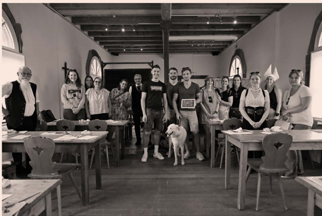
Certificat d'études - Ecomusée d'Alsace - 2023/07/02 - 11h00

Les premiers candidats du dimanche 2 juillet.