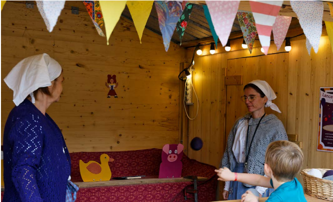
Lancer de balles.