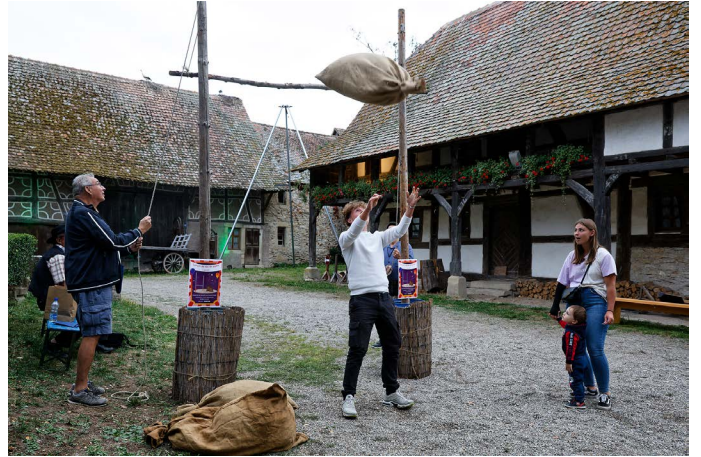
Lancer de sacs.