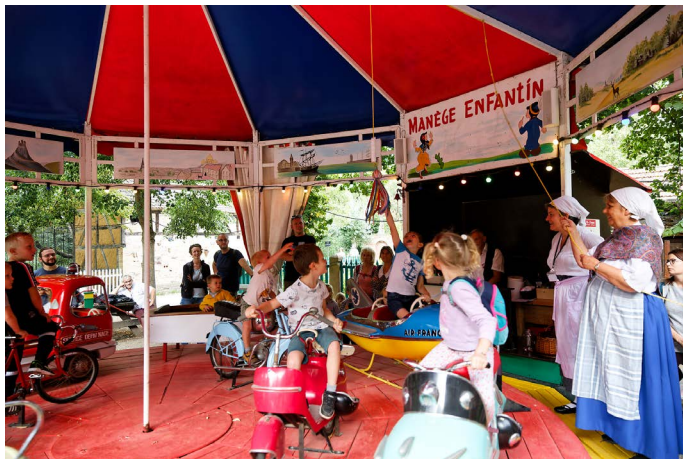
Le manège, malheureusement tombé en panne le premier weekend.