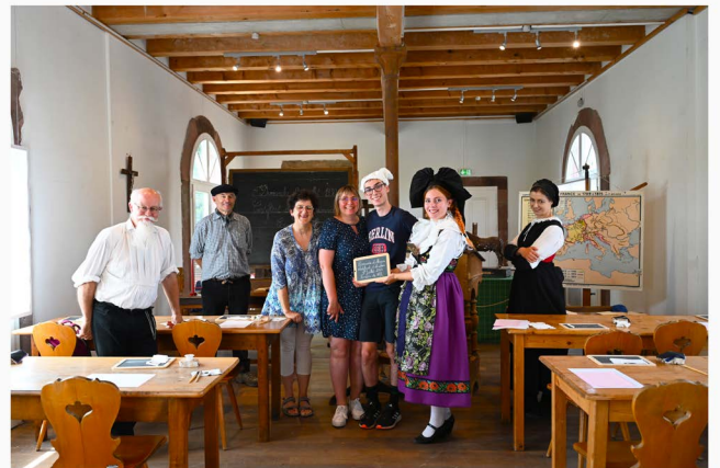
Première session du 9 juillet.