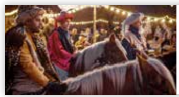
L'arrivée des Rois mages Le 5 janvier 2025

Retrouvez la liste complète des événements sur www.ecomusee.alsace