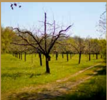
Sentier « parcours des champs » 1500 m.