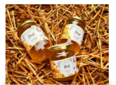
Le miel de l'Écomusée d'Alsace