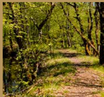
Sentier « émotions forestières » 800 m.