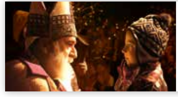
L'arrivée de saint Nicolas Le 8 décembre 2024