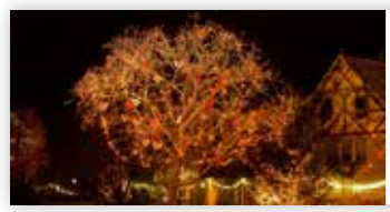
L'Écomusée d'Alsace fête Noël Du 30 novembre 2024 au 5 janvier 2025