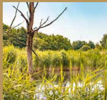
Sentier « étonnants paysages » 2000 m.