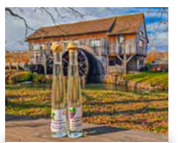
Le schnaps de l'Écomusée d'Alsace

Tous les souvenirs de votre visite à l'Écomusée d'Alsace