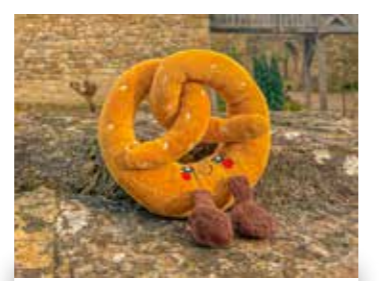
Et plein d'autres souvenirs...

En cas d'urgence, composez le 06 62 17 61 32.